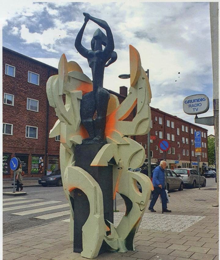
Sorrows from the superstructure. Tusch på papper 2008. The Dancers , Stockholm Wall street festival 2022.