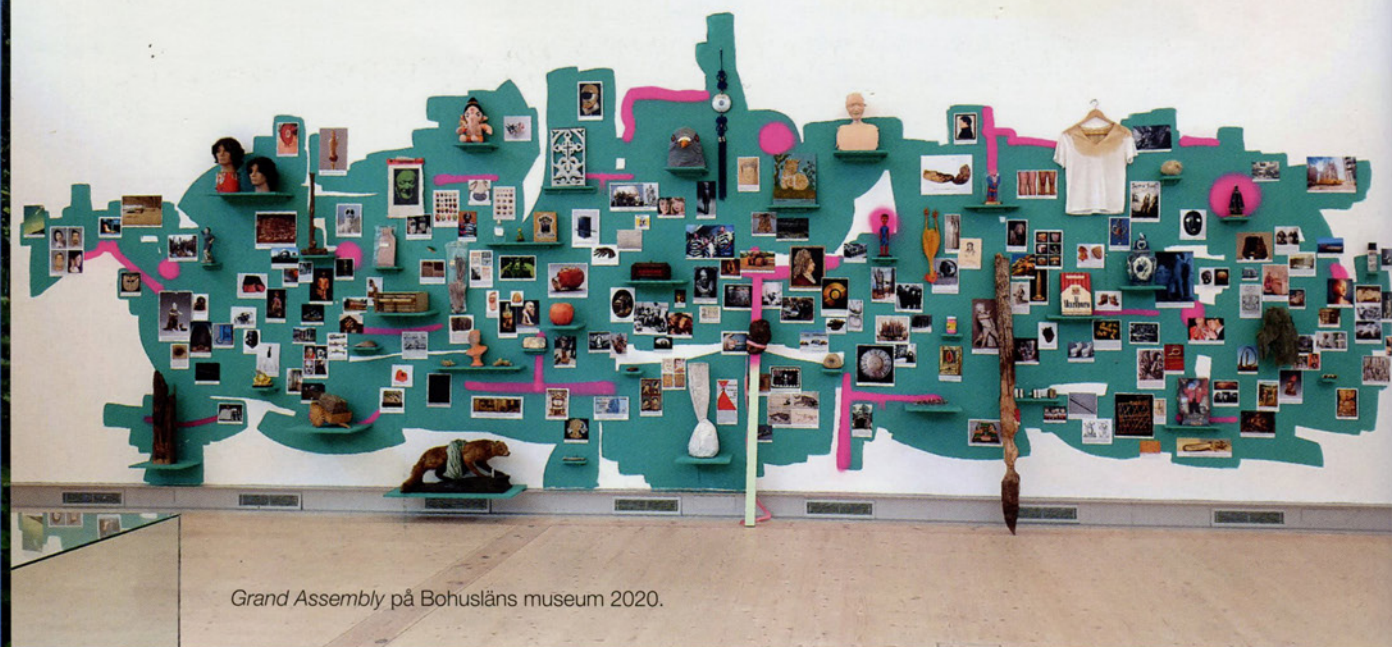
Grand Assembly på Bohusläns museum 2020.

– Jag är ju väldigt intresserad av konsthistoria men upptäckte förvånande nog att jag inte kunde min Grate när jag fick uppdraget. Han tillhör ju en annan generation och det gjorde mig väldigt medveten om hur fort tiden kan gå ifrån ett konstnärskap, och min självpåtagna uppgift i det här fallet blev både att rikta en kärlekshandling och att belysa Grates skulptur.