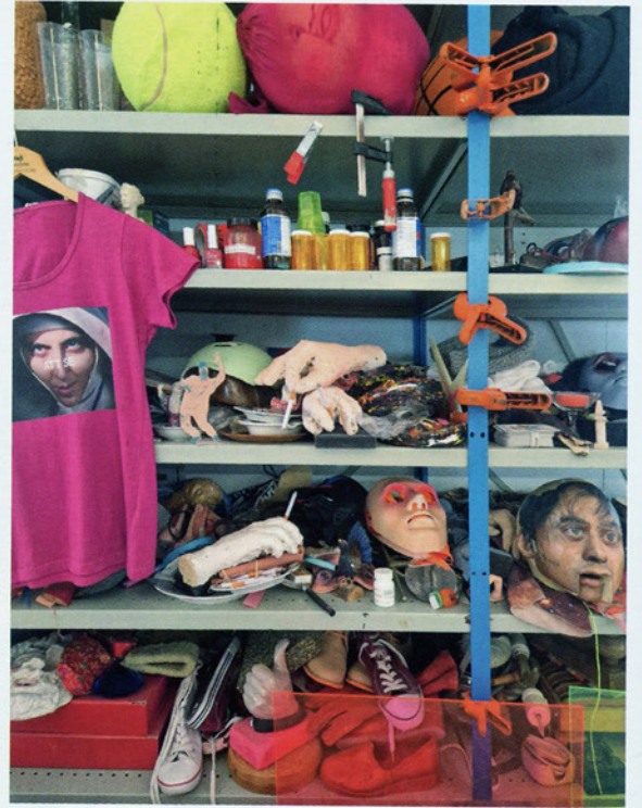
The Raft , Lothringer 13 München 2014. Arbetsmaterial.

Föreläsning om mexikansk wrestling, Lucha Libre, 2021.